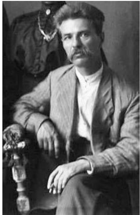
Рис. 2. Сергій Єфремов (1876–1939) Fig. 2. Serhiy Yefremov (1876–1939)

Основними темами в листах до С. Єфремова стали: згортання й переміщення етнографічного відділу музею та боротьба за цілісність його експозиції (Документи № 1–7); затвердження статуту й поточна діяльність Полтавського наукового товариства при ВУАН (Документи № 2, 5, 8); опрацювання архівів і матеріалів П. Мирного, В. Горленка, І. Тобілевича (Документи № 3, 4, 6–8); археологічні справи (Документи № 7–9); приїзд проф. І. Гревса (Документи № 8, 9); пошук роботи в музеях та установах Києва, Дніпра, Харкова (Документ № 9); особисте прохання про працевлаштування від спільної знайомої Н. Мірзи-Авякянц (Документ № 10); поточні справи й атмосфера музейної роботи у Всеукраїнському історичному музеї ім. Т. Шевченка, де, зокрема, згадані А. Виницький, А. Онищук, Д. Щербаківський,