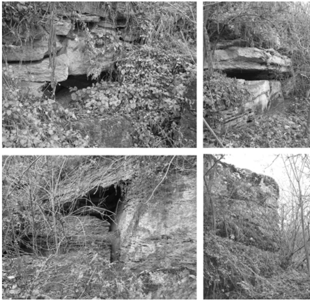
Рис. 1. Залишки перченого монастиря в літописному Василеві