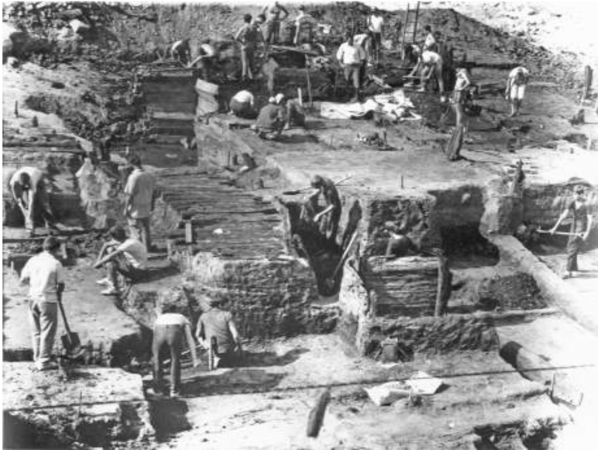
Розкопки на місці будівництва готелю «Золотий Лев». 1992 р.