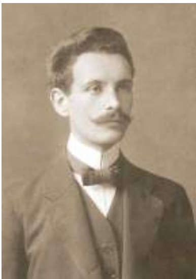
Іван Крип'якевич – професор, академік АН УРСР, директор інституту (1953–1962)

Інститут суспільних наук у складі Львівського філіалу АН УРСР був створений в 1951 р. згідно з постановами Ради Міністрів СРСР № 457 від 21 лютого 1951 р. за підписом Й. Сталіна та Ради Міністрів УРСР № 561 від 23 березня 1951 р. Урядові рішення відразу спрямували всі