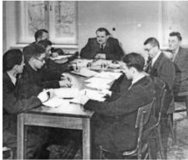
Засідання відділу економіки. 1952 р.

Первісний склад інституту був досить неоднорідним за фаховим рівнем. Підбирали кадри не лише завідувачі відділів – декого переводили з інших установ за вказівками зверху. На 1 липня 1951 р. в інституті налічувалося