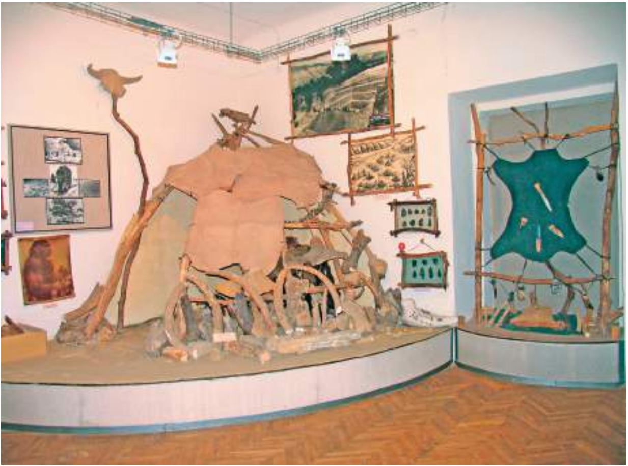
Фрагмент експозиції Археологічного музею