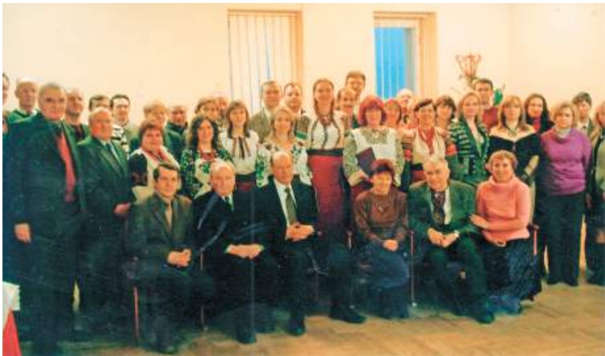
15 січня 2008 р.