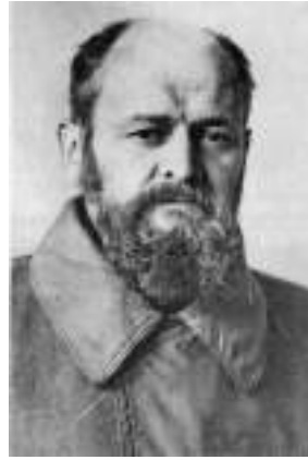
Стефан Круковський. 1960-ті роки