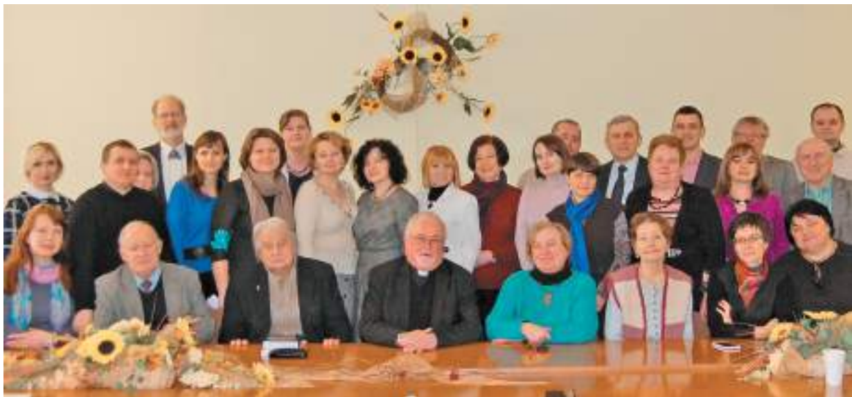
Учасники Міжнародної наукової конференції «Український простір родини Горбачів», присвяченої 100-річчю від дня народження проф. Олекси Горбача. 22 лютого 2018 р.

Пам'ять про родину Горбачів трепетно зберігається у відділі й після їхнього відходу до вічності. Непересічна наукова подія відбулася 22 лютого 2018 року у стінах Інституту українознавства ім. І. Крип'якевича НАН України – конференція «Український простір родини Горбачів», присвячена 100-річчю від дня народження проф. Олекси Горбача.