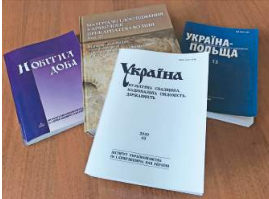
Фахові видання інституту

На жаль, треба зазначити, що матеріально-технічна база потребує кардинального оновлення. Окрім ремонту приміщень (уже понад 25 років – без ремонту в будинку на вул. Козельницька, 4; понад 50 (!) – на вул. Винниченка, 24), необхідна модернізація матеріальної та інформаційно-технологічної інфраструктури кабінетів, зокрема створення мультимедійних, та бібліотеки, забезпечення їх функційності.