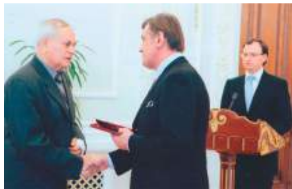
Президент України Віктор Ющенко нагороджує Кіма Науменка орденом «За заслуги» III ступеня. Листопад 2007 р.

Важливі проблеми міжвоєнного періоду та Другої світової війни досліджені через оцінку національно-державницькими партіями