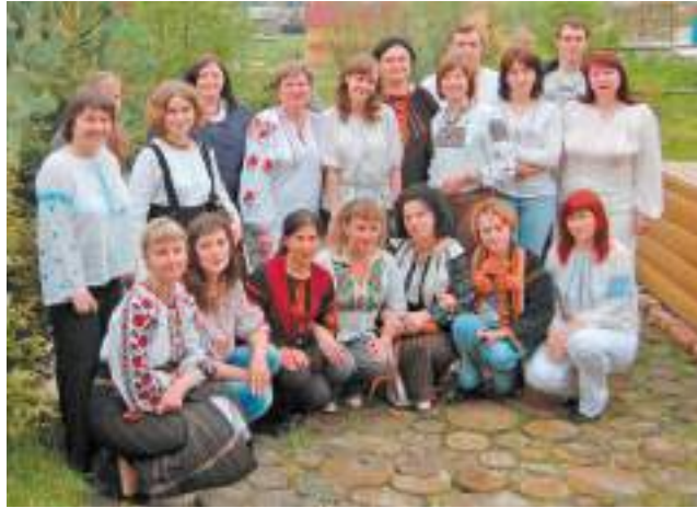
Учасники Міжнародної наукової конференції «Говори південно-західного наріччя у слов'янському контексті». Травень 2008 р., с. Славське