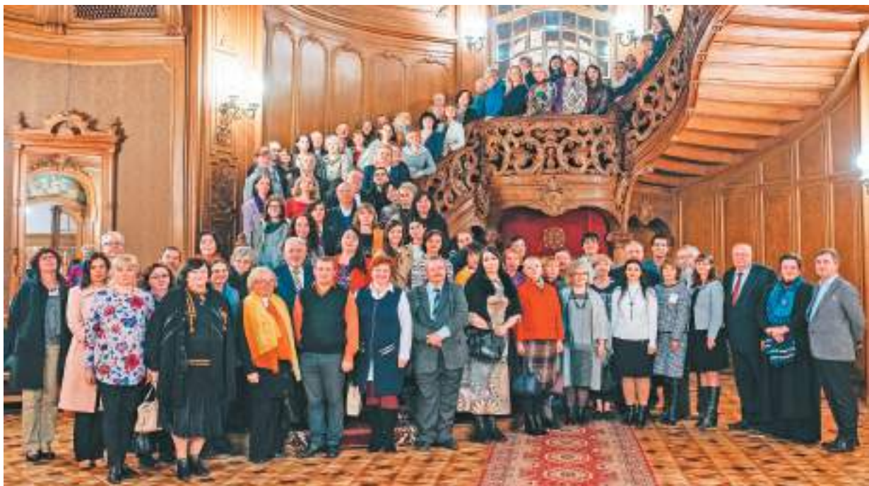
Учасники Міжнародної наукової конференції «Діалектний часопростір. Світлої пам'яті Наталі Хобзей». Будинок вчених. 10–11 жовтня 2019 р.