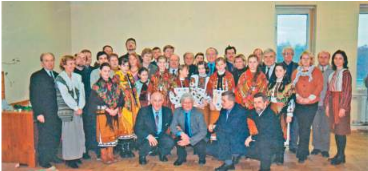
Свято Маланки. Січень 2004 р.