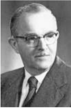
Ярослав Пастернак. 1940-ві роки