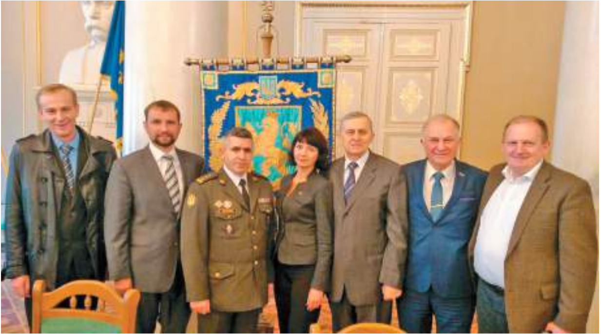
Учасники наукової конференції, присвяченої Українському визвольному руху ХХ ст. Львів, 2018 р.