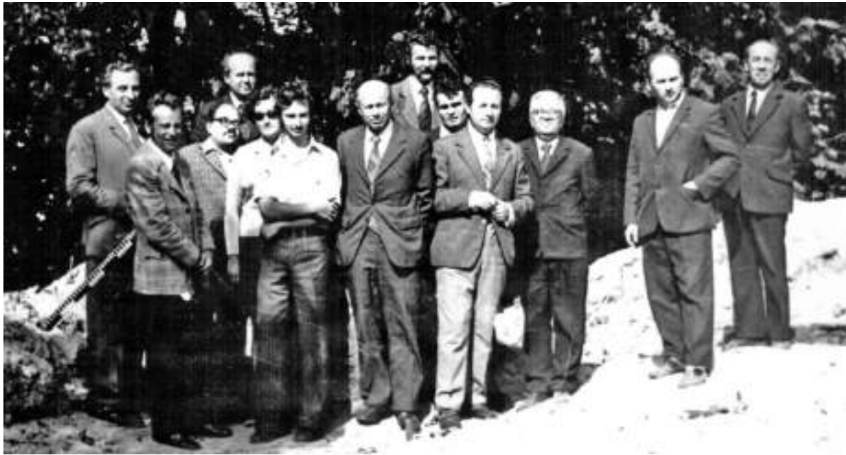
Співробітники відділу археології та інші науковці Інституту суспільних наук АН УРСР на розкопках Романа Багрія. Львів. Високий замок. 1975 р.

підставі цих та інших розкопок (Звенигороді, Гологорах, Крушельниці тощо) дослідниця виокремила локально-хронологічну групу, яку назвала черепинсько-лагодівською. Низка нових пам'яток, відкритих на Західній Волині, у верхів'ях річок Західний Буг та Стир, дали підстави Л. Крушельницькій виділити тут лежницьку групу.