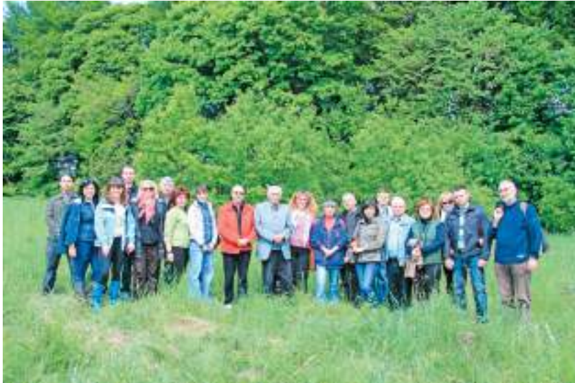
Учасники виїзного засідання конференції «Археологія заходу України» на Пліснеському городищі. 2012 р.

Експозиція привертає увагу нестандартністю художнього вирішення та новизною наукового підходу. Вона створена за історико-хронологічним і художньо-реконструктивним методами. Поряд з оригінальними артефактами з каменю, кістки, рогу, глини, показані технічні реконструкції у натуральну величину способів житлобудівництва в палеоліті (понад 50 тис. р. тому), у період існування трипільської культури (IV–III тис. р. до н. е.), у ранньослов'янський час (VI–VIII ст. н. е.), відтворені стародавні методи обробки шкіри, свердління кам'яних сокир, виготовлення горщиків і мисок, плавки заліза тощо.