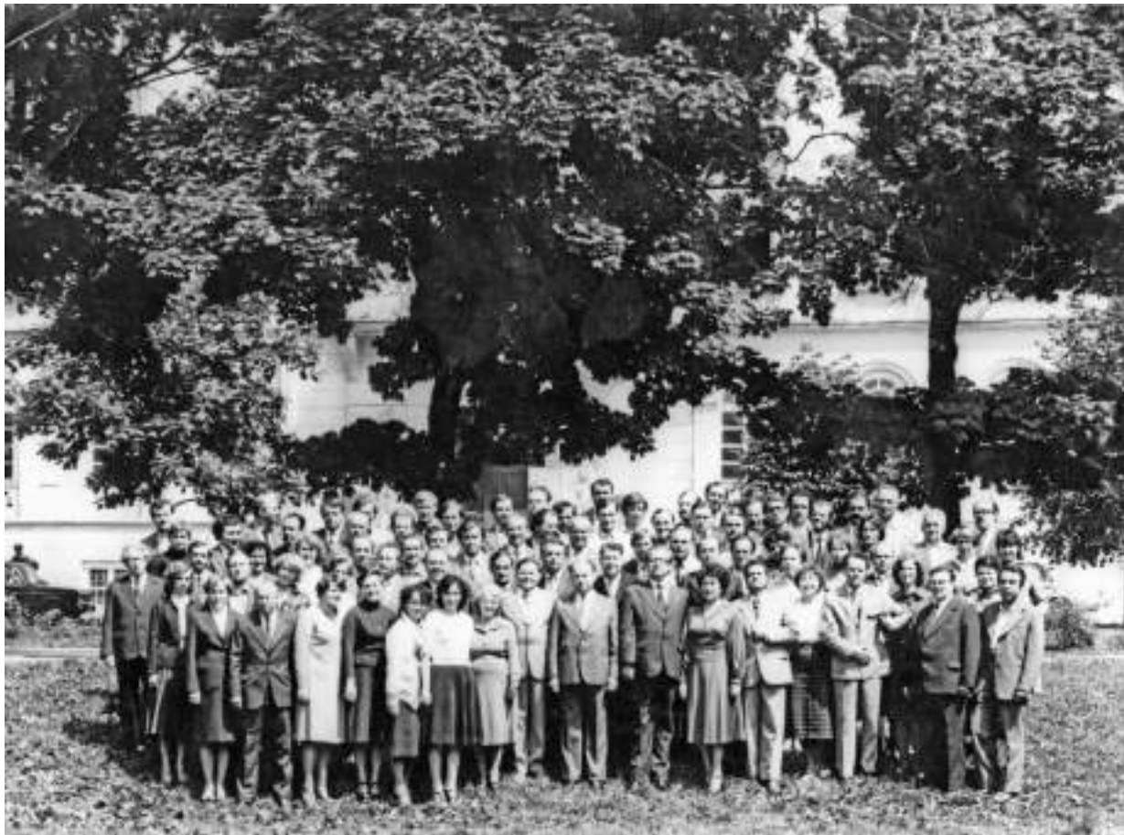
Учасники урочистого засідання з нагоди 30-річчя інституту. Львів, 16 червня 1981 р.