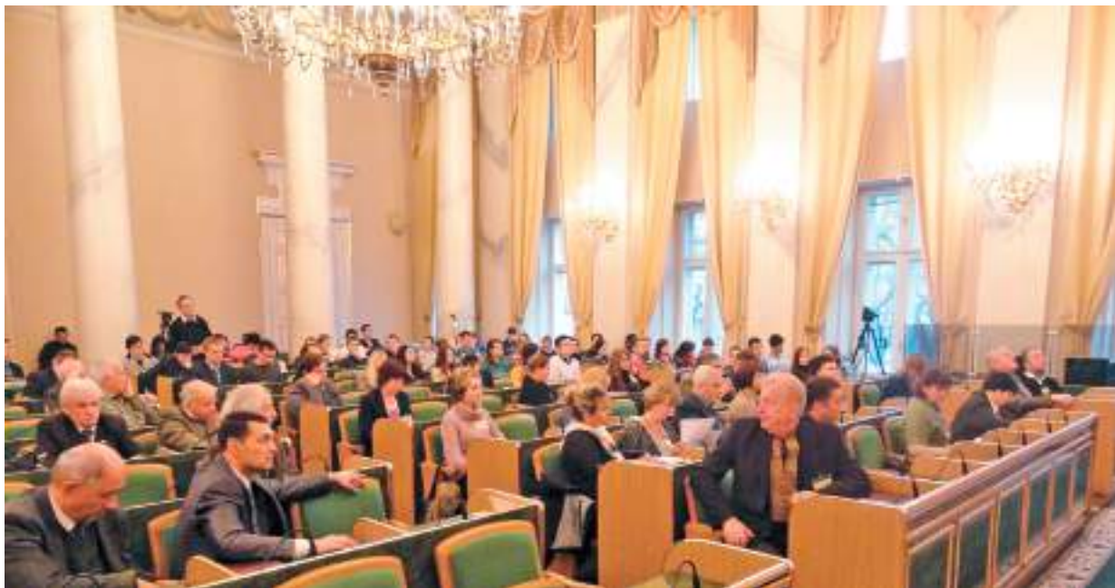
Міжнародна наукова конференція «Проблеми дослідження українського визвольного руху середини XX століття». Сесійна зала Львівської обласної ради, 14 листопада 2014 р.

Розкрито важливі проблеми партійно-політичного життя західноукраїнського суспільства в міжвоєнний час, соціально-економічну діяльність українців Галичини у 1921–1939 рр., репресії угорської та польської влад щодо галичан-січовиків у Карпатській Україні 1939 р., особливості суспільних процесів у західноукраїнських землях на початку Другої світової війни.