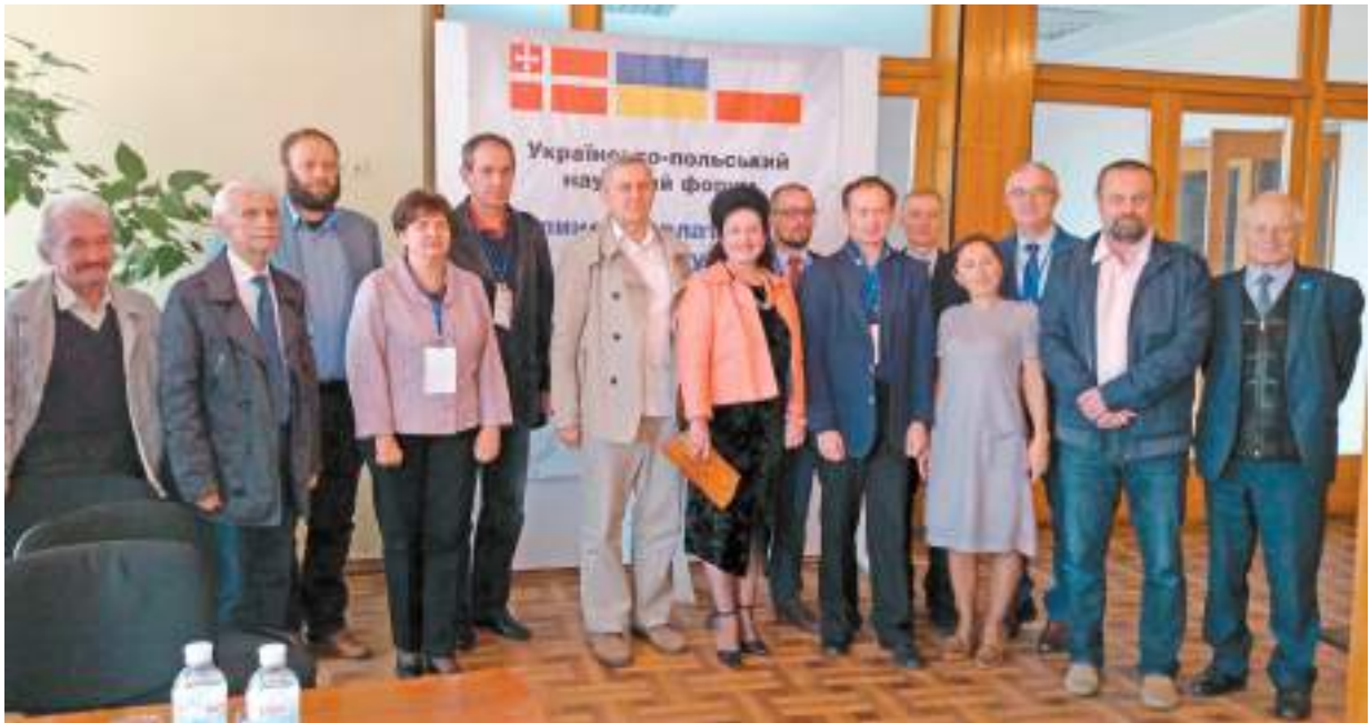
Учасники Українсько-польського наукового форуму, співорганізованого центром. Луцьк, 2019 р.