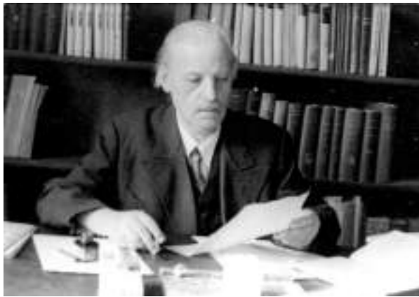
Йосиф Пеленський. 1940-ві роки