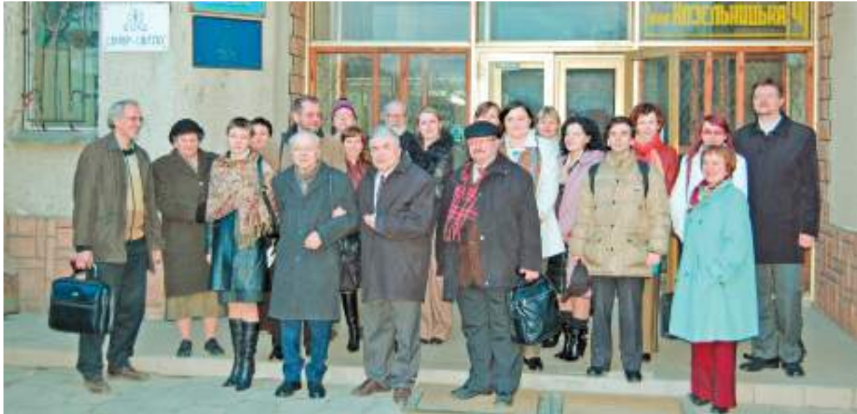
Учасники Міжнародної наукової конференції «Галичина – простір, люди, мови». 28–29 березня 2008 р.