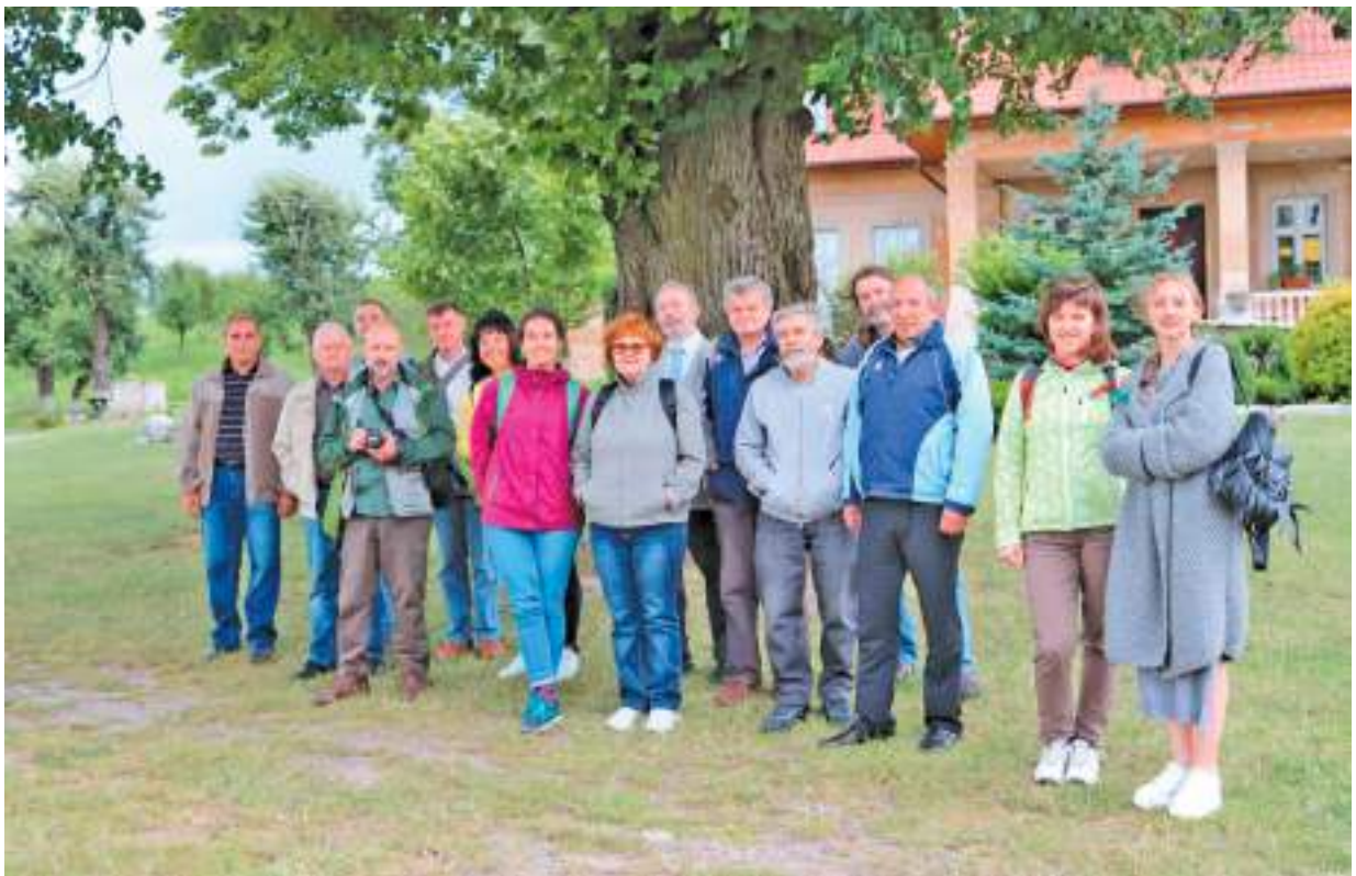
Учасники наукового семінару, присвяченого 50-річчю Галицької археологічної експедиції. Галич, 11 липня 2019 р.