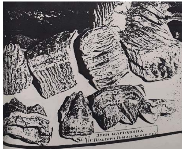
Рис. 4. Зуби палеомастодонта, знайдені Юрієм Шумовським на Волині. Фото експозиції Рівненського краєзнавчого музею, 1943 р.

Однак реалізувати плани відразу не вдалося – музей було переведено до іншого приміщення. Події, що це спричинили, Ю. Шумовський описує у спогадах: “Але не довго цей будинок був у наших руках. Прибула до Рівного головна квартира СС і оберштурмфюрер СС з’явився до мене забрав найкращі гобеліни, кераміку, образи і сказав за один день цілком звільнити будинок для потреб головної квартири СС. Що було нам робити? ... Я дістав у бурмістра міста другий будинок під музей, але вже маленький звичайний приватний будинок жидівський по вул. Короленка № 6... До того будинку ми перенесли перевезли все що було можливо з великого будинку, бо військовики що прийшли нам помагати СС-вці хапали образи дорогоцінні Коссаката та інші і кидали просто