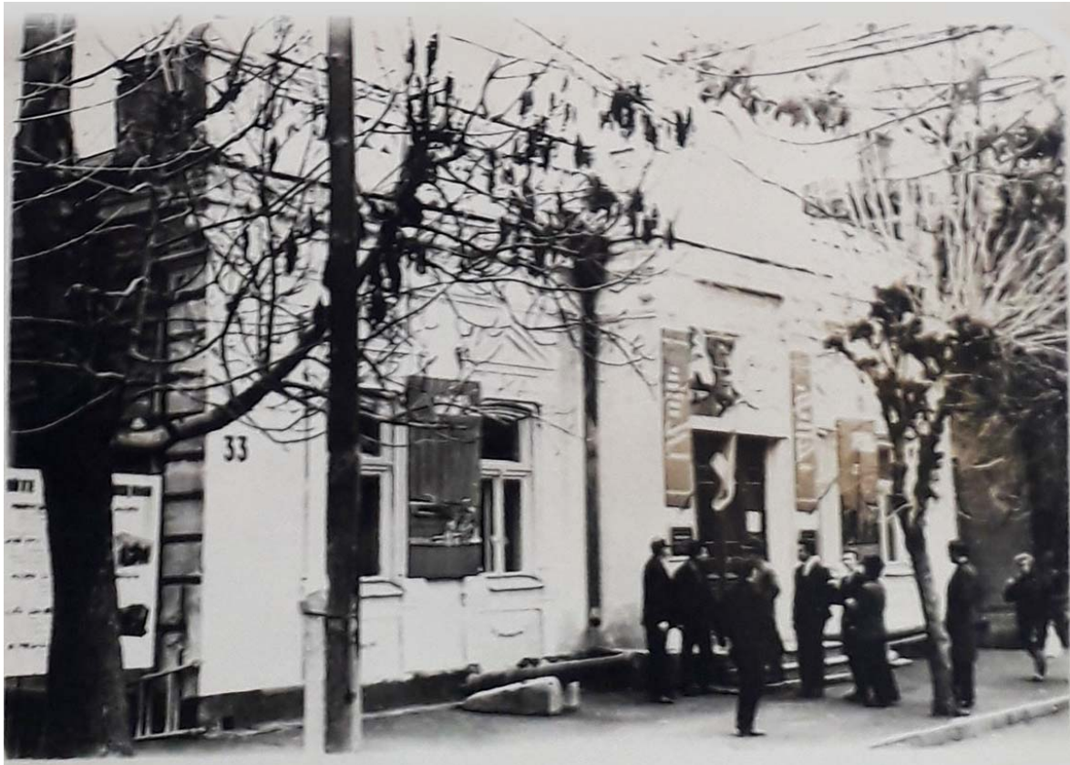
Рис. 1. Перше приміщення Рівненського краєзнавчого музею – будинок “Української рідної хати” біля Воскресенського собору. м. Рівне, на вул. Соборна, 1941 р.