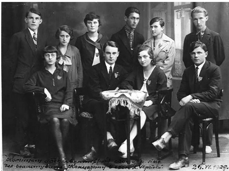
Фото 3. Організаційний комітет із проведення концерту на честь Лесі Українки. Ярослав Стецько стоїть крайній праворуч

Краківському університеті. Шлях до навчання у Львові тоді для нього був закритий через «неблагонадійність» в очах польської влади випускників Тернопільської української державної гімназії, закритої 1930 р. (Климишин, 2002, с. 47).