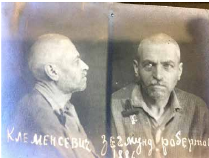
Рис. 6. Світлина проф. Зигмунда Клеменсевича під час перебування у в'язниці. Київ, 1940 р.