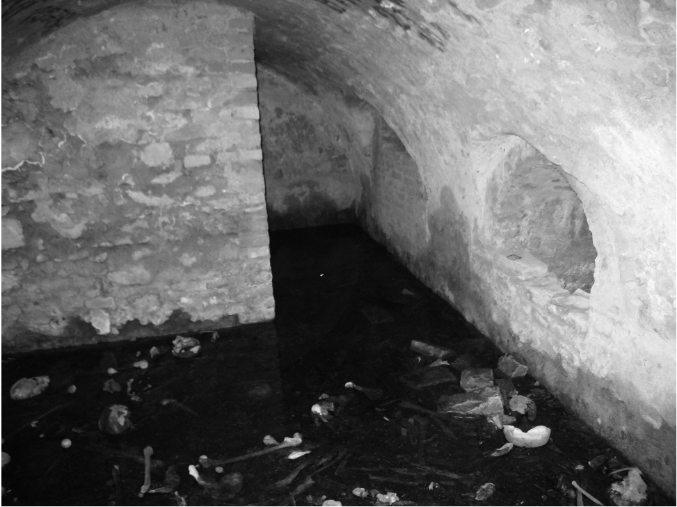
Фото 3. Дубно. Кармелітський костел Святого Йосифа. Крипта. Ніші у східній погребальній коморі. 2017 р.