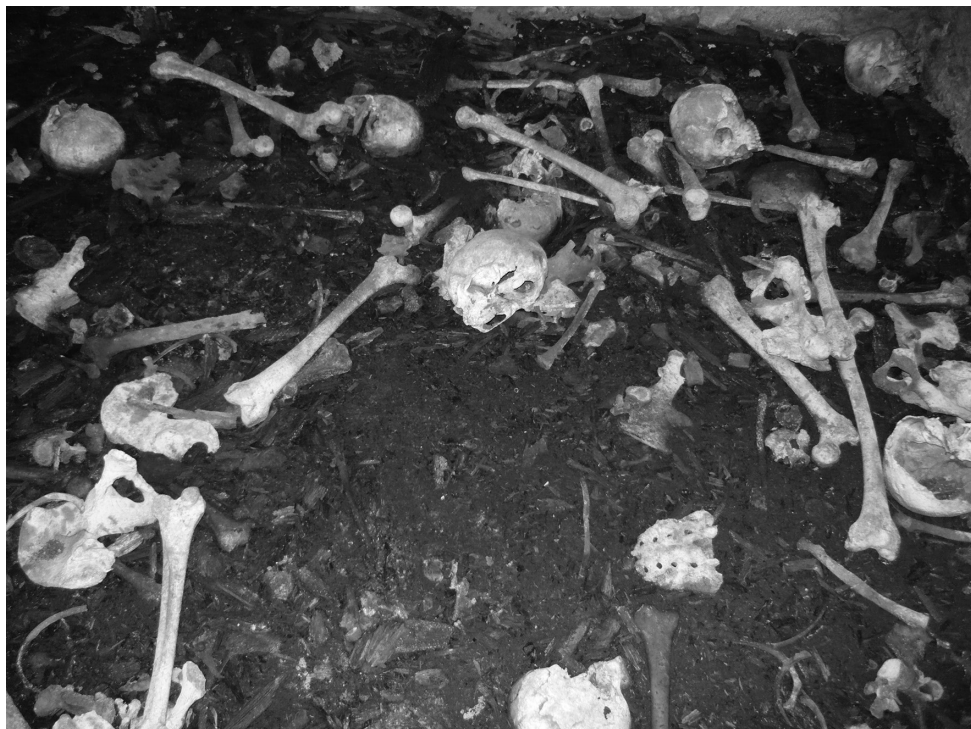
Фото 2. Дубно. Кармелітський костел Святого Йосифа. Крипта. Знищені поховання. 2017 р.