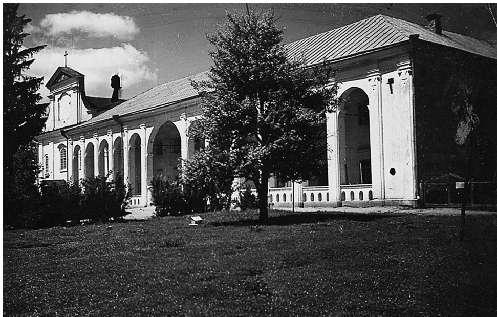
Фото 1. Дубно. Кармелітський костел Святого Йосифа. Східний фасад келійного корпусу (на передньому плані) і храму (на задньому). Листівка початку XX ст.