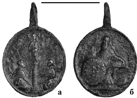
Фото 5. Дубно. Кармелітський костел Святого Йосифа. Крипта. Медальйон (Матір Божя Сарагоська/св. Бенедикт), XVIII ст.