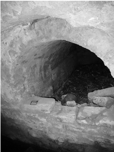
Фото 4. Дубно. Кармелітський костел Святого Йосифа. Крипта. Ніша з рештками поховання. 2017 р.