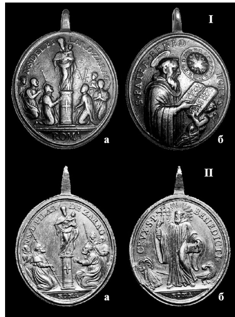
Фото 6. Медальйон (Матір Божа дель Пілар Сарагоська/св. Бенедикт). XVIII ст. Іспанія (за Аутамі 2015)

Дослідники припускають, що центри продукування медальйонів з образом св. Бенедикта розташовувалися в Німеччині (Нізуьскі, 2001, с. 9), Франції – для вервичок сестер милосердя (Kołoszko, 2013, s. 132), особливо – в Італії, у монастирі на Монте Кассіно, а також в Австрії, де відомі численні бенедиктинські осередки (Białobłocki, 1991/1992, s. 179).