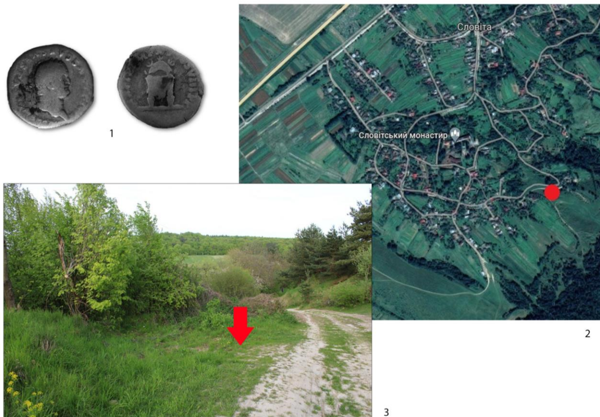
Рис. 1. Місце знахідки скарбу у с. Словіта (1 – на Google Maps; 2 – фото Н. Демського, 2023) та монета Тита (3) з нього (фото без масштабу)

Депозит, імовірно в кілька сотень монет, було випадково виявлено на початку 1975 р. під час розширення дороги на південно-східній околиці села, в ур. За копані (рис. 1, 2). Місце знахідки розташоване на північному схилі пагорба висотою близько 380 м н.р.м., який прилягає до прокладеної біля нього дороги (рис. 1, 3). Перші свідчення про скарб опубліковані в короткому повідомленні «Подарок римського імператора» («Подарунок римського імператора») у газеті «Труд», у номері від 25 лютого 1975 р., тобто практично відразу після його відкриття [Чернобров, 1975]. У тексті короткої замітки міститься інформація, що скарб нібито знайшов тракторист колгоспу ім. 17 вересня Ярослав Кіндрат під час проведення земляних робіт у Золочівському р-ні (без зазначення назви населеного пункту). Вказано також кількість монет – 500 шт., датованих часом імператора Веспасіана [Чернобров, 1975]. Повний зміст замітки повторно опубліковано 2000 р. у праці Владислава Кропоткіна із приміткою, що монети зберігаються у краєзнавчому музеї м. Золочева [Кропоткин, 2000, с. 51, № 2275]. Однак треба зауважити, що в 1970-х роках музею у Золочеві ще не існувало.