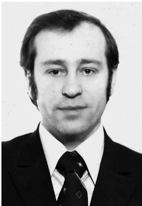
Рис. 1. Роман Грибович (1946–2011) Fig. 1. Roman Grybovych (1946–2011)

ім. І. Крип'якевича НАН України) Олександр Черниш (1918–1993). Поруч із проведенням польових досліджень, введенням у науковий обіг нових матеріалів, результатом діяльності цієї школи стало формування фахівців, які продовжили справу О. Черниша з вивчення кам'яної доби Заходу України. Одним із представників цієї школи був Роман Грибович, який багато польових сезонів брав участь у роботах палеолітичних експедицій, очолюваних Олександром Чернишем, а згодом зосередив свою увагу на дослідженні мезолітичних пам'яток Волині (рис. 1).