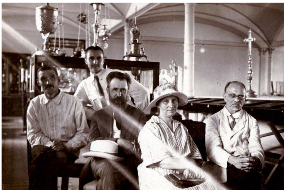
Рис. 1. Петро Курінний (1894–1972), Олександр Якубський (1891–?), Ігнатій Крачковський (1883–1951), Віра Крачковська (1884–1947), Агатангел Кримський (1871–1942). Київ. Лаврський музей культур та побуту. 1925 р. [НА ІА НАН України, ф. 10, спр. 54, арк. 26]