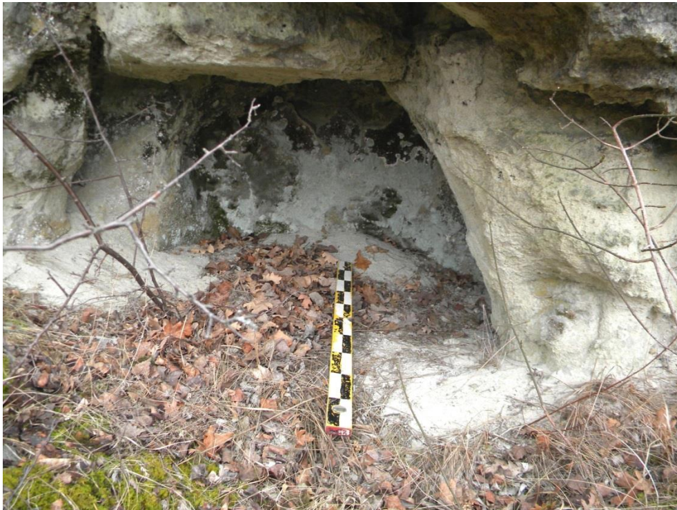
Рис. 5. Напівзруйнована печерна пам'ятка біля Миколаєва Fig. 5. Partially destroyed cave site near Mykolaiv