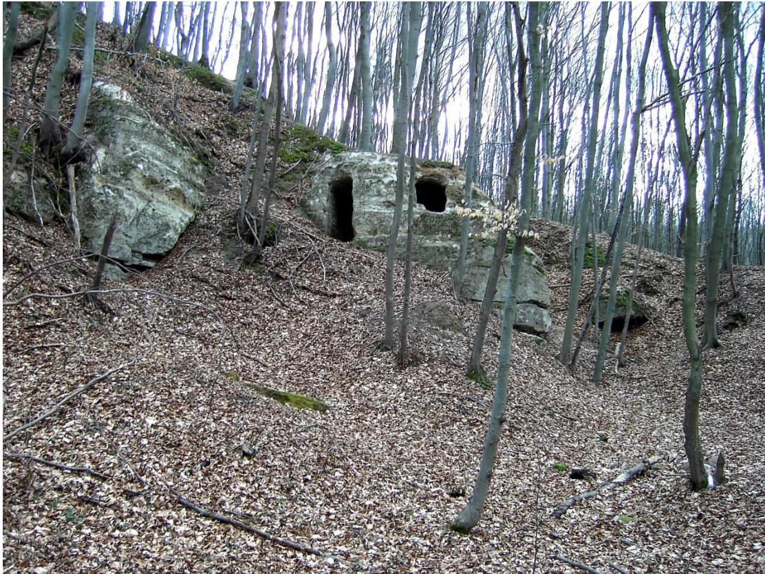
Рис. 4. Печерна пам'ятка біля с. Руда Рогатинського р-ну Івано-Франківської обл.