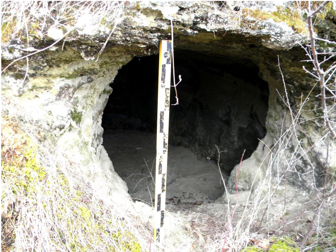
Рис. 2. Вхід у печерну камеру Fig. 2. Entrance to a cave chamber

Печерні камери мали різні розміри. Крім одноосібних печерних споруд, трапляються порожнини більших розмірів. Іноді вони могли помістити кілька людей. Такі великі камери з культовими нішами є поблизу печерних монастирів у Страдчі й Розгірчі [Берест, 2011, с. 125]. Про кількість мешканців печерної камери може свідчити число культових ніш. Адже кожен інок мав свого святого покровителя, іконка якого стояла в ніші, і він присвячував йому щоденну молитву. Якщо в печерній камері є дві й більше культових ніш, то це могло бути печерне житло ченців-келіотів. Вони порушували статутні правила і проживали в одній камері по кілька осіб, що заборонялося статутному чернецтву.