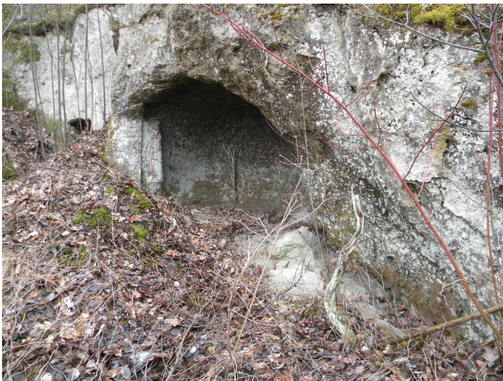
Рис. 6. Напівзруйнована печерна пам'ятка біля Миколаєва Fig. 6. Partially destroyed cave site near Mykolaiv