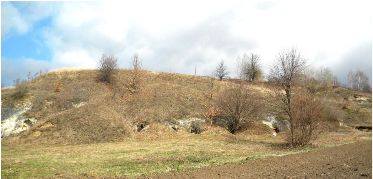
Рис. 1. Печерні камери біля с. Луб'яна Миколаївського р-ну Львівської обл.