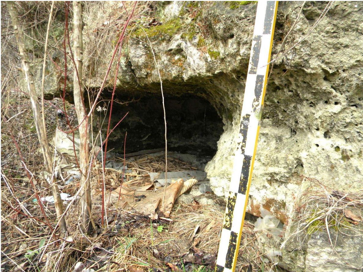
Рис. 7 Напівзруйнована печерна пам'ятка біля Миколаєва Fig. 7. Partially destroyed cave site near Mykolaiv

Вказана пам'ятка могла б успішно слугувати потребам розвитку краєзнавства, туризму, виховання на рівні об'єднаної територіальної громади (ОТГ), району чи області. Проте тривалий період вона залишаються маловідомою спорудою навіть для місцевих мешканців.