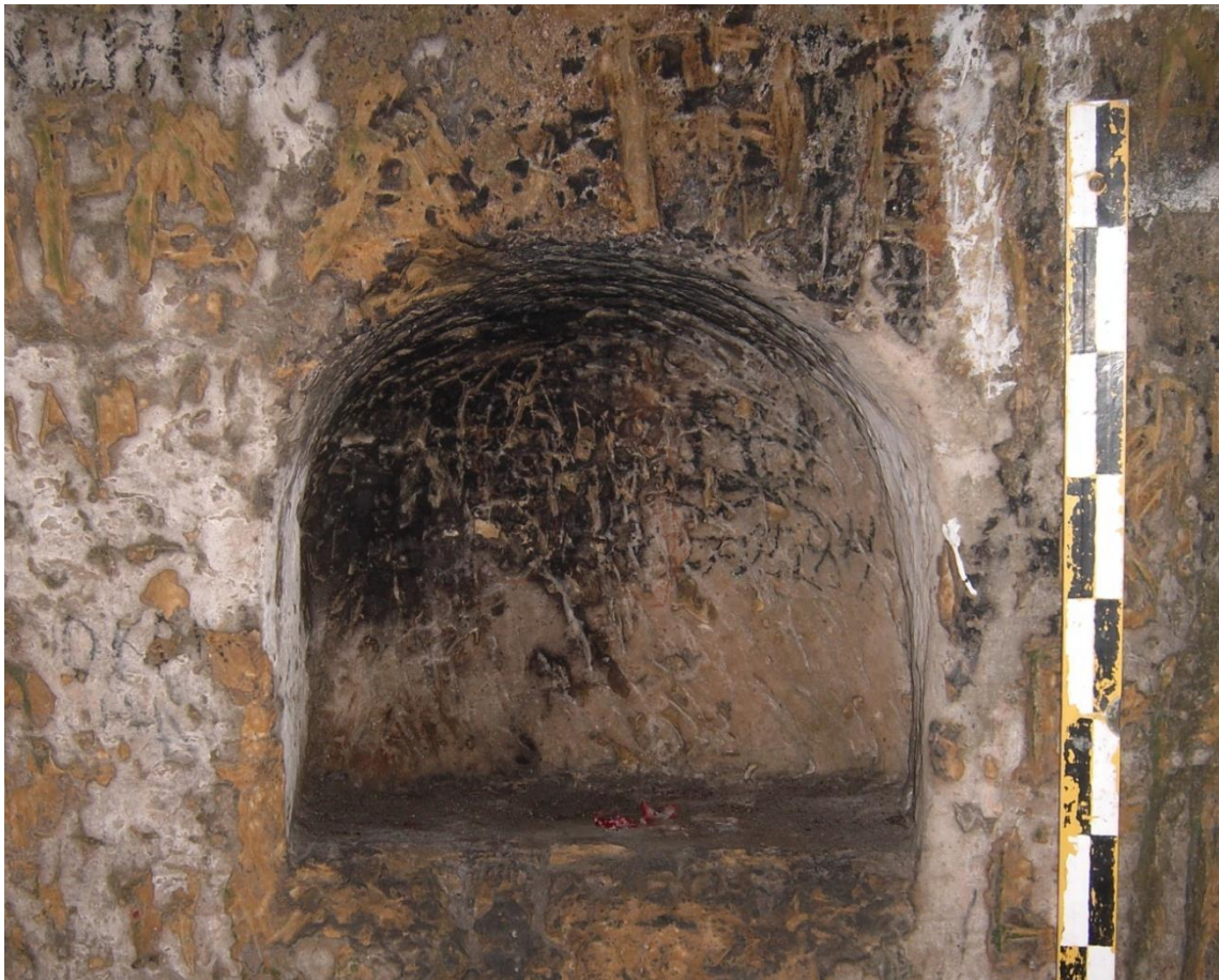
Рис. 3. Культова ніша