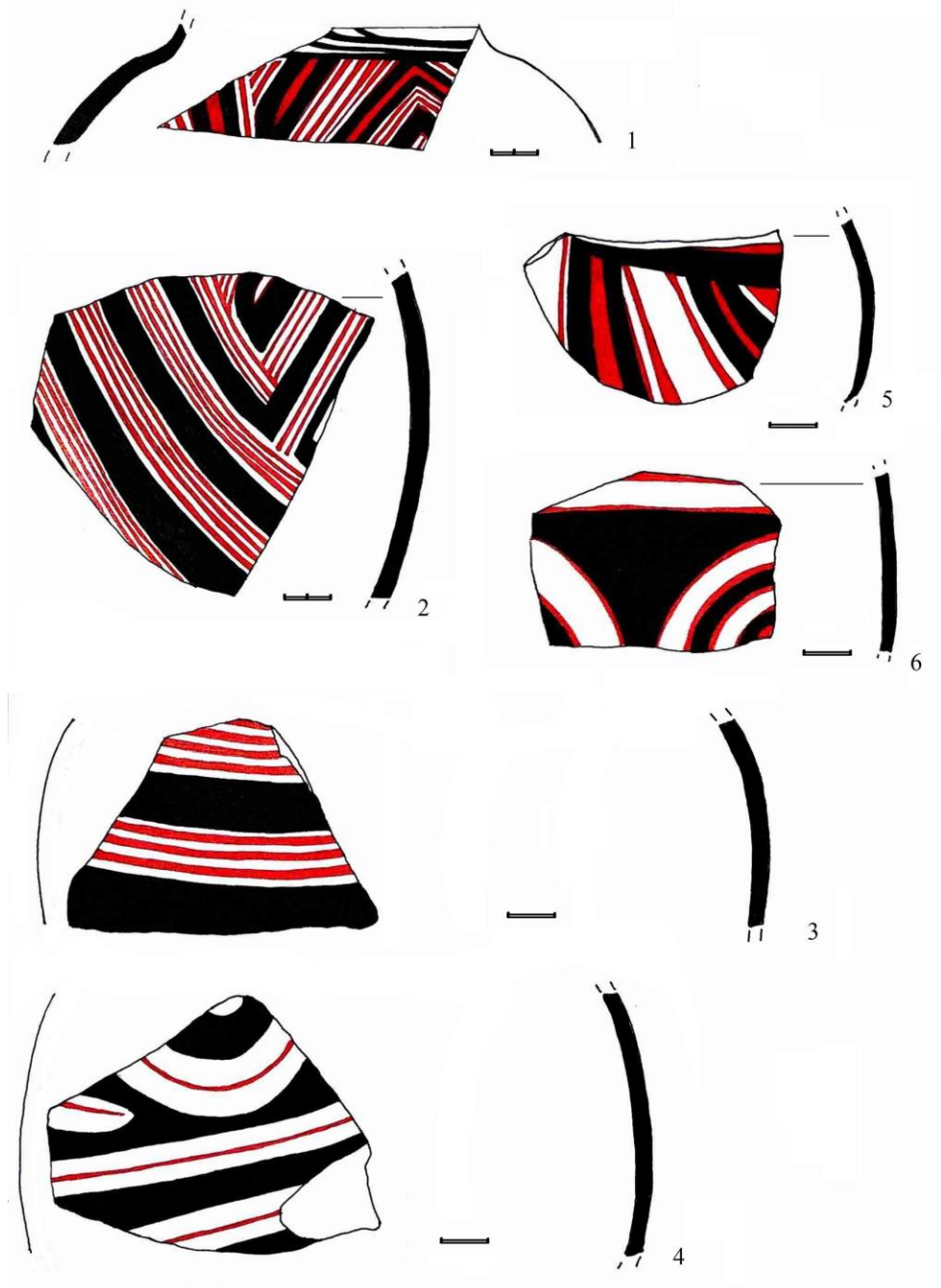
Рис. 3. Кераміка трипільського поселення Шипинці А (фонди Львівського історичного музею)

Глибокі миски з широкими дещо опуклими вінцями не зникли в подальшому – така форма побутувала на трипільських поселеннях етапу VI–VII (Заліщики, Бучач).