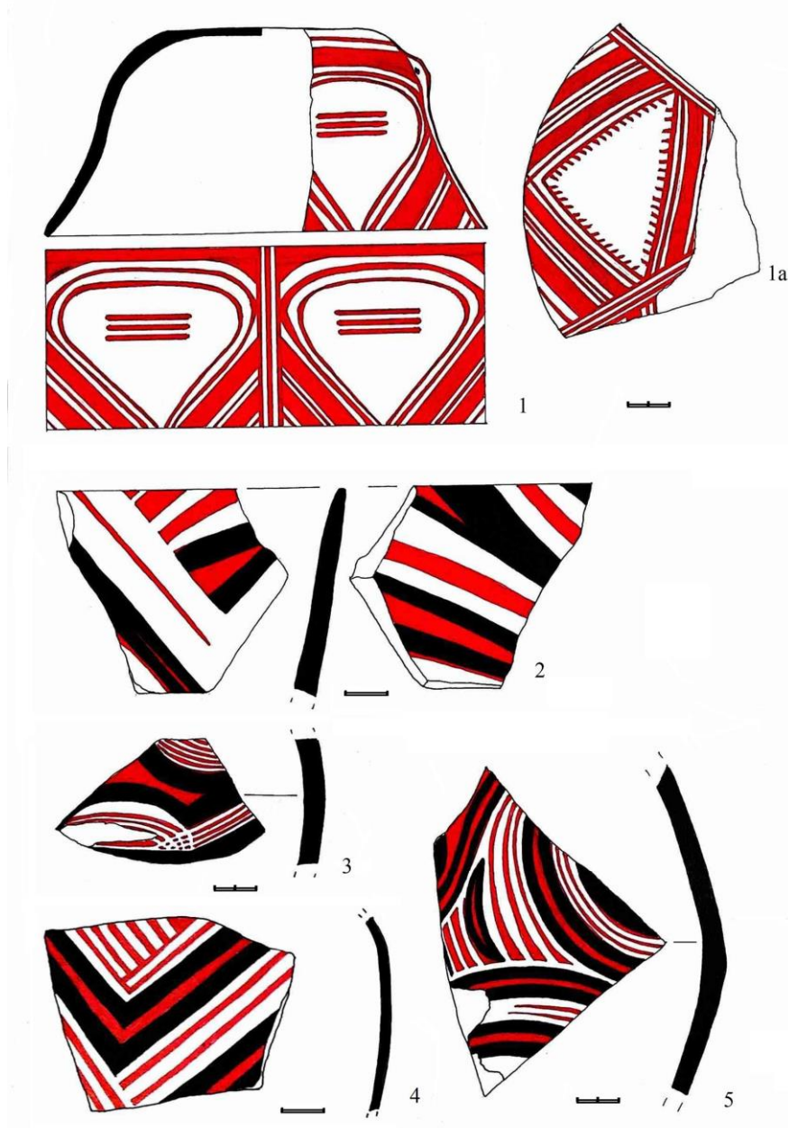
Рис. 2. Кераміка трипільського поселення Шипинці А (фонди Львівського історичного музею) Fig. 2. Ceramic ware from settlement of Trypillia culture Shypyntsi A (collections of the Lviv Historical Museum)

У збірці присутній винятково «столовий» посуд, як правило, мальований. У фондах ЛІМу відсутні зразки із заглибленим орнаментом, але про його наявність у керамічному комплексі Шипинців А писав О. Кандиба: «... фрагмент з білою фарбою, який був орнаментований рядами ямок і заглибленими лініями» [Кандиба, 2007а, с. 126]. Мальований посуд має такі форми: кубки, покритки, миски, грушоподібні посудини, чаші на піддоні, біноклеподібні посудини, ложки або черпаки.