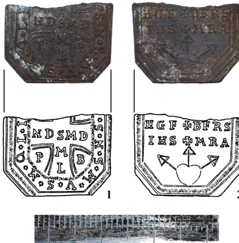
Рис. 7. Фрагмент релігійного медальйона. 1 – аверс. Хрест св. Бенедикта; 2 – реверс. Молитва св. Захарія. XVII ст. (Фото і рисунок В. Мойжес) Fig. 7. Fragment of the religious locket. 1 – obverse. Cross of St. Benedict; 2 – reverse. Prayer of St. Zechariah. XVII century (Photo and figure by V. Moizhes)