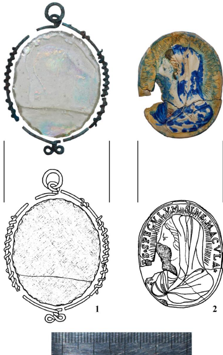
Рис. 3. Фрагменти медальйона-каплера. 1 – скляна шибка аверсу і мосяжна рамочка; 2 – аверс. Матір Божа. XVII ст. (фото і рисунок В. Мойжеса)

Окремий різновид медальйонів репрезентує зразок, виконаний у вигляді тонкої металевої пластини (рис. 7). Збереглася лише нижня половина виробу, але численні аналогії, відомі з теренів Європи, дозволяють якнайдетальніше реконструювати його цілісність. Технологічна відмінність цього зразка від розглянутих – те, що двосторонні рельєфні зображення нанесено за допомогою штампа. В основі іконографії – написи, точніше їх скорочення. Спосіб написів представлено двояко: в одному випадку (на аверсі) окремі літери – це заголовні букви слів, у