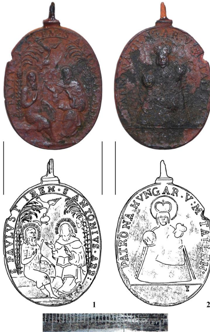
Рис. 6. Релігійний медальйон. 1 – реверс. Святи Антоній і Павло; 2 – реверс. Матір Божа. XVII ст. (фото і рисунок В. Мойжес)

божественне одкровення. Він почув голос, який сповістив, що у відлюдді є пустельник, який досяг вершин самозречення і його треба навідати. Антоній пустився в дорогу. Самітники зустрілися і довго бесідували. Цей момент і відображено на медальйоні.