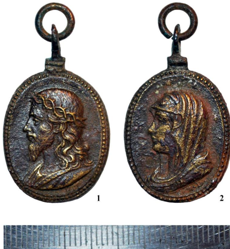
Рис. 4. Релігійний медальйон. 1 – аверс. Христос; 2 – реверс. Матір Божа. XVII – перша чверть XVIII ст.

присутність образу Богородиці на ньому закономірна. Адже в середньовіччі, крім святих, за допомогою у подоланні мору зверталися до Матері Божої Милостивої й Матері Божої Милосердної. Цікаві в цьому контексті т. зв. чумні стовпи, які досі збереглися у численних містах Центральної та Західної Європи. Їх встановлювали впродовж XVII–XVIII ст. на честь подолання епідемій. Один із найдавніших відомий у Мюнхені (1638). Вершину колон дуже часто вінчала фігура Матері Божої, переважно в образі Пречистої Діви Непорочного Зачаття (Іммакулати). Ймовірно, що розглядуваний медальйон також мав аналогічне призначення.