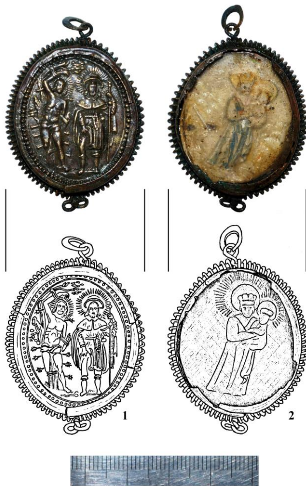
Рис. 2. Релігійний медальйон-каплер. 1 – реверс. Святи Севастіан і Рох; 2 – аверс. Богородиця з Дитятком Ісусом. XVII ст. Вигляд після реставрації (фото і рисунок В. Мойжес)