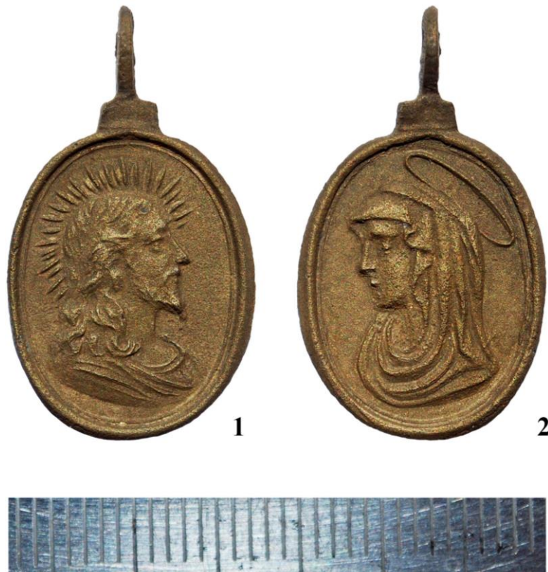
Рис. 5. Релігійний медальйон. 1 – аверс. Христос; 2 – реверс. Матір Божа. Перша чверть XVIII ст.