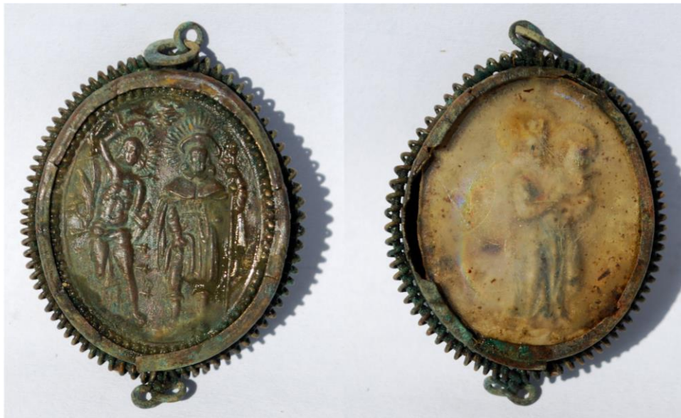
Рис. 1. Релігійний медальйон-каплер. 1 – реверс. Святі Севастіан і Рох; 2 – аверс. Богородиця з Дитятком Ісусом. XVII ст. Вигляд до реставрації (фото В. Мойжес)

У межах абсиди й більшої частини центрального нефу (досліджено площу 170 м 2 ) нашарування простежено до рівня материка, який місцями залягав до глибини 2,4 м. Верхній шар досліджених ділянок (до 0,4–0,6 м від рівня підлоги церкви) складався винятково із завалу каменю, цегли, будівельного розчину, штукатурки й уламків нервюр від готичного склепіння. Нижче зафіксовано верхівки стін від наявних тут крипт, які різняться розмірами та технікою мурування. Усі поховальні камери виявилися зруйнованими та пограбованими, а останки понищеними. Ділянку в межах крипт заповнено будівельним сміттям, що містило розрізнені людські кістки.