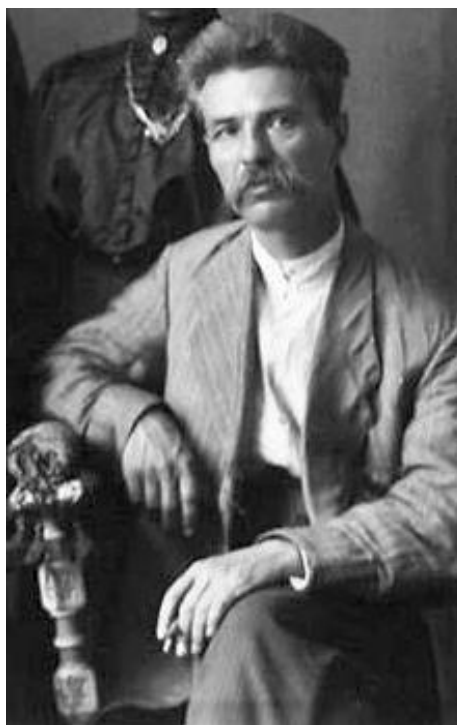
Рис. 2. Сергій Єфремов (1876–1939) Fig. 2. Serhiy Yefremov (1876–1939)

Основними темами в листах до С. Єфремова стали: згортання й переміщення етнографічного відділу музею та боротьба за цілісність його експозиції (Документи № 1–7); затвердження статуту й поточна діяльність Полтавського наукового товариства при ВУАН (Документи № 2, 5, 8); опрацювання архівів і матеріалів П. Мирного, В. Горленка, І. Тобілевича (Документи № 3, 4, 6–8); археологічні справи (Документи № 7–9); приїзд проф. І. Гревса (Документи № 8, 9); пошук роботи в музеях та установах Києва, Дніпра, Харкова (Документ № 9); особисте прохання про працевлаштування від спільної знайомої Н. Мірзи-Авякянц (Документ № 10); поточні справи й атмосфера музейної роботи у Всеукраїнському історичному музеї ім. Т. Шевченка, де, зокрема, згадані А. Виницький, А. Онищук, Д. Щербаківський,