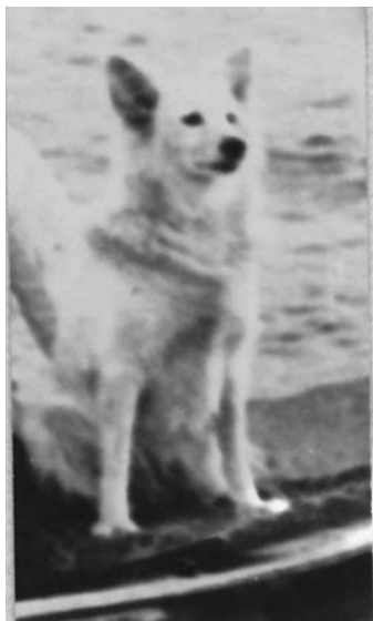
Рис. 5. Улюблений пес Михайла Рудинського Буля Fig. 5. Mykhailo Rudynsky's favorite pet Bulia

У результаті довгих перемовин про переселення музею досягнуто тимчасового рішення про згортання етнографічного музею на першому поверсі та залишення за етнографічним відділом 2 поверху