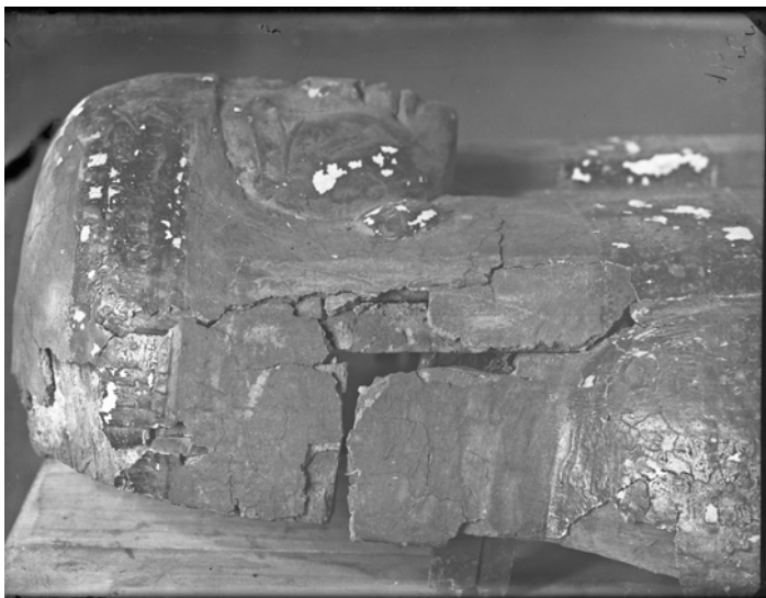
Рис. 6. Фотонегатив № 66. Віко жіночого саркофага, нині зберігається в Одеському археологічному музеї НАНУ, інв. № 71695

Також варто згадати, мабуть, найбільшу київську приватну колекцію, яку зібрав художник і дослідник стародавнього мистецтва проф. Адріан Вікторович Прахов, яка включала 159 пам'яток [Тураєв, 1900, с. 208–217], в тому числі статуетки, ушебті, фрагменти саркофагів, ієратичний папірус, фрагменти мумій тощо. Ймовірно, що деякі із предметів, представлених на негативах НА ІА НАН України, можуть походити із його колекції, наприклад, рука людської мумії, хоч для точного визначення чи спростування цього припущення варто продовжувати архівні пошуки.