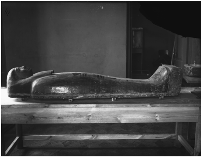
Рис. 7. Фотонегатив № 38. Віко жіночого саркофага, нині зберігається в Одеському археологічному музеї НАНУ, інв. № 71700