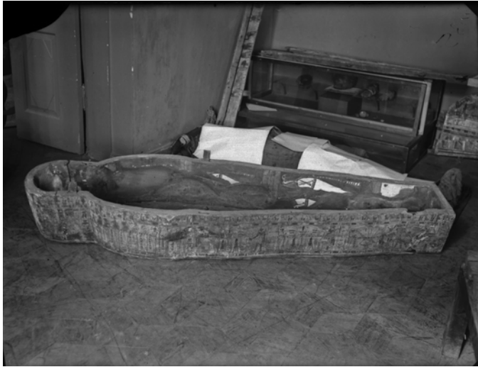
Рис. 9. Фотонегатив № 18. Скриня саркофагу та мумія, нині зберігається в Національному Києво-Печерському історико-культурному заповіднику (КПЛ-Арх-828) Fig. 9. Photographic negative N 18. Coffin case and mummy, now in National Kyiv-Pechersky Historical and Cultural Preserve (inv. nr KPL-Arch-828)

це вказано у “Звіті за пророблену працю в Реставраційній Майстерні Станкового Малярства при В.М.Г. за час від 1/Х–1928 р. по 1/Х–1929 р.”: “4. Складено описи стану єгипетських саркофагів збірки ВМГ” [ЦДАВО України, ф. 166, оп. 11, спр. 522, арк. 11зв.].