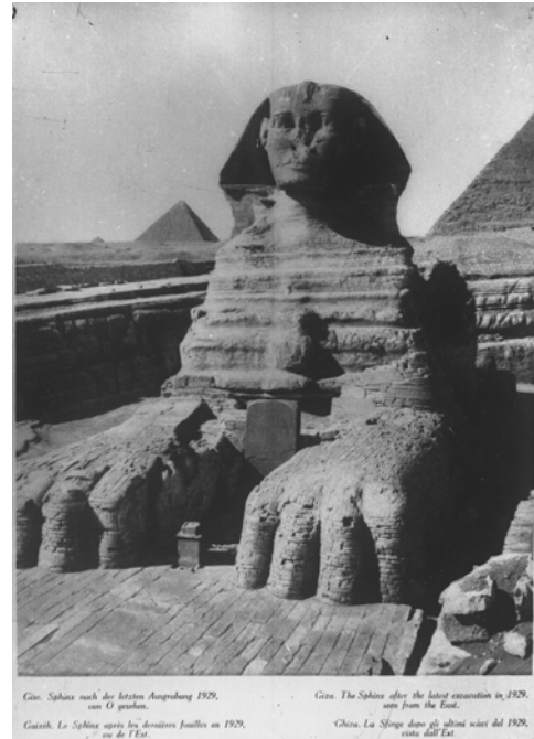
Рис. 2. Фотонегатив № 109. Репродукція ілюстрації, що зображає Великого Сфінкса

Водночас, якщо для нумерації репродукцій, які йдуть першими, проглядається певна система, нумерація тієї частини негативів, яка репрезентує давньоєгипетські об'єкти, не співпадає із порядком їхнього фотографування, і в результаті зображення одного і того ж предмета з різних боків виявляється розкиданим по різних номерах. Наприклад, маска римського періоду, яка нині зберігається в Національному музеї мистецтв імені Богдана та