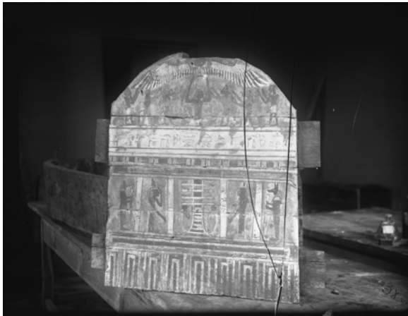
Рис. 8. Фотонегатив № 2. Дерев'яний прямокутний саркофаг зі склепінчастим віком, який був закуплений Б. Ханенком у Каїрському музеї для Київського художньо-промислового і наукового музею

Fig. 8. Photographic negative 2. Wooden rectangular coffin with vaulted lid, which was bought by B. Khanenko from Cairo Museum for the Kyiv Museum of Arts, Crafts and Sciences