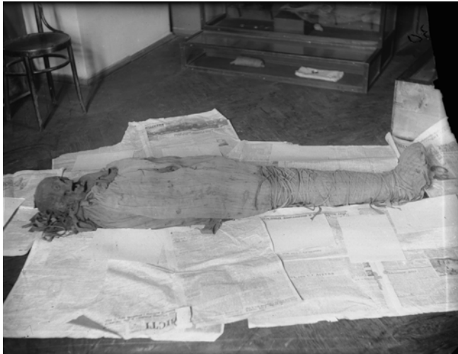
Рис. 4. Фотонегатив № 72. Мумія на газеті “Известия” Fig. 4. Photographic negative N 72. A mummy is put on the newspaper “Izvestiya”

Проглянувши візуальний ряд давньоєгипетських предметів, що зображені на негативах, я змогла встановити, що частина з них показує об'єкти, які нині зберігаються в таких музеях Києва, як Національний музей мистецтв імені Богдана та Варвари Ханенків та НКПІКЗ, або в Одеському археологічному музеї НАН України, куди були свого часу передані разом із іншими давньоєгипетськими речами із київських музеїв [Romanova, 2008, p. 337].