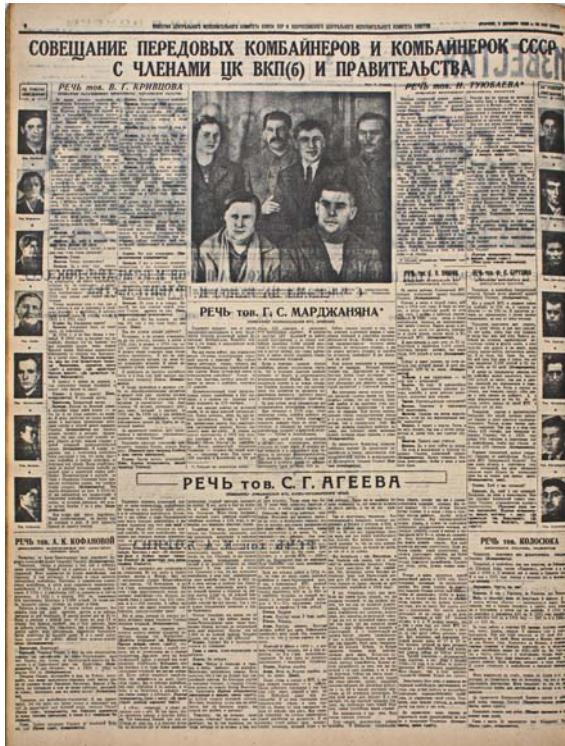
Рис. 5. Газета "Известия" від 3 грудня 1935 р., № 280 (5833)

багаторічні пошуки в десятках архівів у різних містах і різних республіках СРСР, і було неможливим для двох дослідників. І на разі ця тематика ще залишається величезним цілинним полем, яке лише почали розорювати.