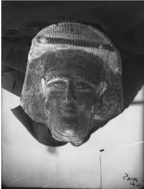
Рис. 3. Фотонегатив № 78. Маска, яка нині зберігається в Національному музеї мистецтв ім. Богдана та Варвари Ханенків

Навряд чи в книзі мали бути представлені пам'ятки в такому хаотичному порядку. Наприклад, щоб низка світлин одного предмету переривалася фотографією іншого предмету. Якщо припустити, що ці негативи виникли в результаті документування процесу реставрації давньоєгипетських об'єктів, то в цьому випадку теж незрозумілою є їхня хаотична нумерація.