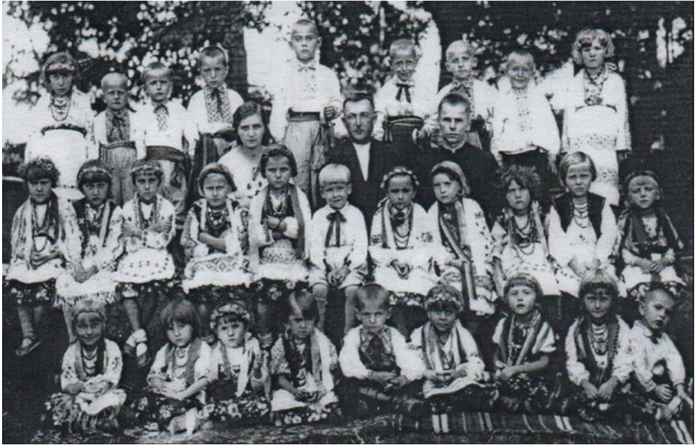
У дитячому садку (останній ряд, третій зліва). 1938 р.