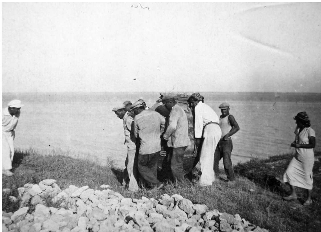
Рис. 1. Ольвія. 1937 р. Робочі моменти (транспортування піфоса)