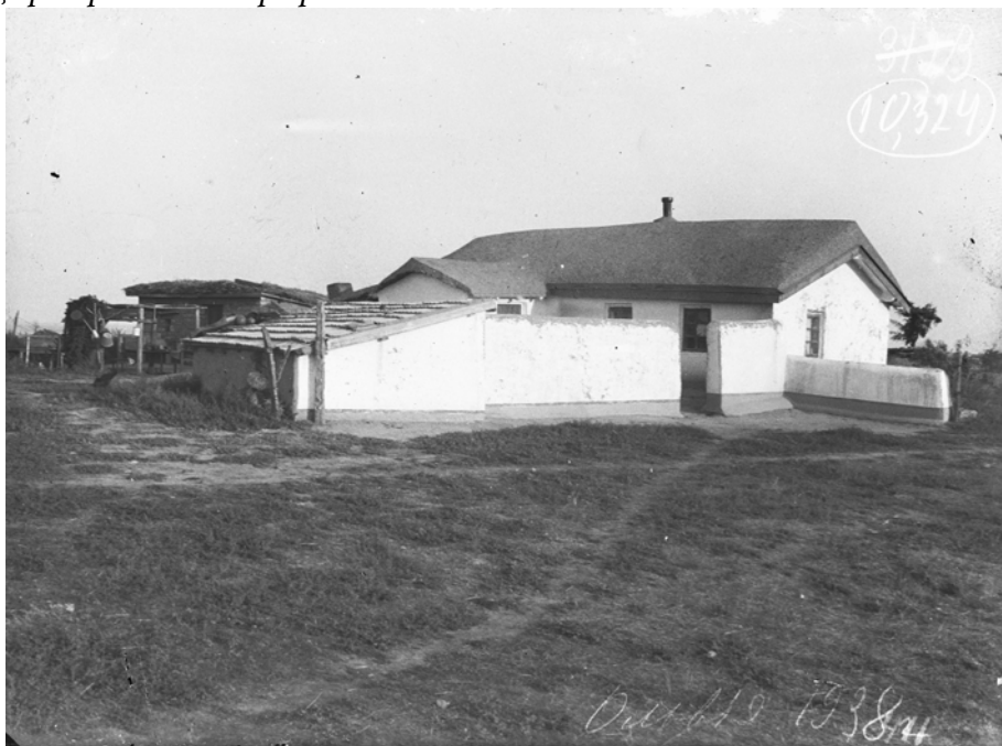
Рис. 4. Будинок № 5. Хата коменданта заповідника, вигляд з південного заходу. 1938 р. [НА ІА НАНУ, ф. 57, од. зб. 10324]

Питання реставрації Ольвії тісно пов'язані з збереженням комплексної цілості матеріалу, що розкривається при розкопках.