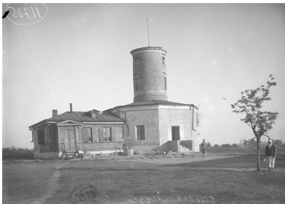
Рис. 6. Будинок музею (колишня сигнальна башта)