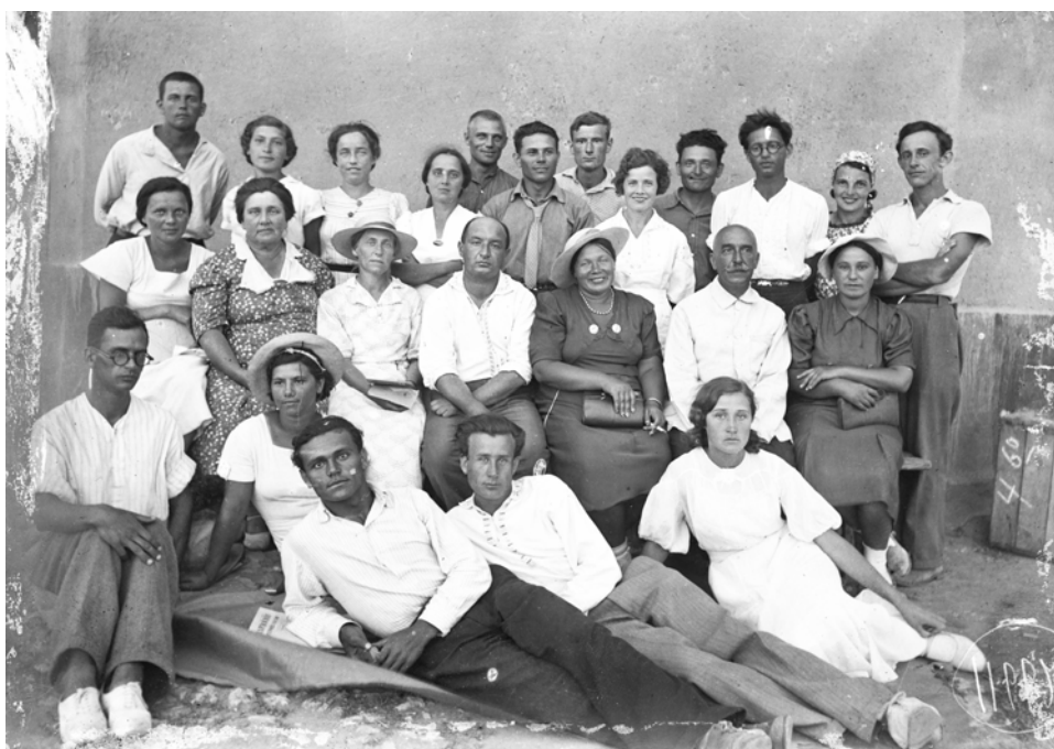
Рис. 5. Ольвія. 1939 р. Співробітники експедиції (НА ІА НАНУ, ф. 57, од. зб. 11662)