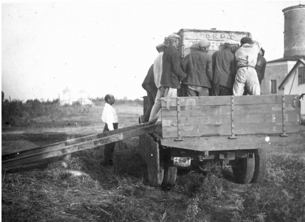
Рис. 2. Ольвія. 1937 р. Робочі моменти (транспортування піфоса)

Греко-римські колонії на чорноморському узбережжі в значній мірі були джерелом постачання продуктів і сировини метрополії тому, що звідси вивозили величезну кількість хліба, худоби, меду, риби й інших товарів; а також робочої сили, тобто рабів, – через це вивчення пам'ятників матеріальної культури колоній і, зокрема Ольвії, набуває великого загально-історичного інтересу [...]