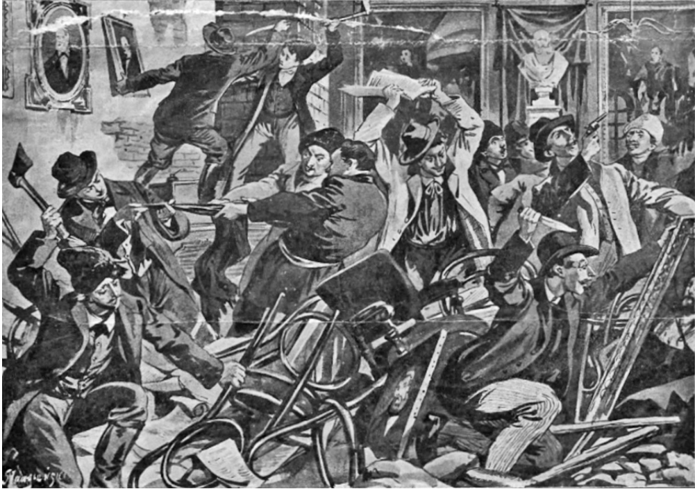
Ілюстрація першої сторінки краківської газети «Nowości illustrowane» за 2 лютого 1907 р. (Стаття «Hajdamacy na lwowskim uniwersytecie»)

у цивілізаційному світовому поступі 25 . У наступні роки це питання знову піднімали Євген Олесницький, Олександр Барвінський та Юліан Романчук 26 .