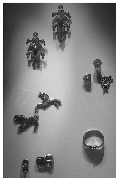
Рис. 1. Частина ювелірних виробів Мартинівського скарбу в експозиції Британського музею

Сучасна російська історична наука тенденційно підійшла до оцінки скарбу і російськомовного перекладу праці Т. Сулімірського. Вже в назві роботи «Сармати» перекладач