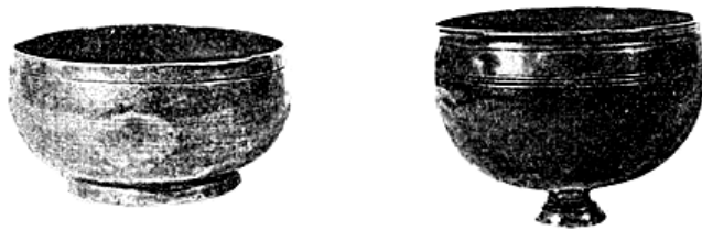
Рис. 2. Чаша та кубок із колекції Мартинівського скарбу (за: Приходнюк та ін., 1991, с. 273)

Діаметр вінчика чаші становить 84–85,5 мм. Його межі визначає неглибока врізна лінія, нанесена у верхній частині виробу. Діаметр піддона – 56–59 мм, а його висота – приблизно 6 мм. Повна висота чаші – 45 мм. За принципом технології виготовлення її варто віднести до виробів штампово-ковальської роботи. Вона має характерно потовщений вінчик і помітно розширений тулув, який у нижній частині різко звужується до основи піддона – тим самим утворюється сферичне дно чаші.