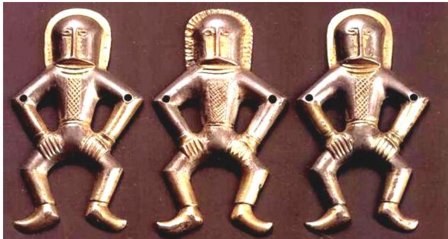
Рис. 4 Антропоморфні литі фігурки з колекції Мартинівського скарбу (за Приходнюк та ін., 1991, с. 269) Fig. 4, Anthropomorphic cast figurines from the Martyniv hoard collection (by Приходнюк та ін., 1991, с. 269)

Розміри фігурок невеликі. Вони мають ознаки лиття і відображають звірів у профіль. На їхній поверхні простежується різний ступінь позолоти. Дві фігурки мають однакову висоту – 62,1 мм і довжину – 95,4 мм. Їх відрізняють право- й лівостороннє відображення профілю тварини, а також незначні розбіжності у формі голови, гриви, туловища, положення ніг тощо. Товщина виробів становить приблизно 2,5–3 мм.