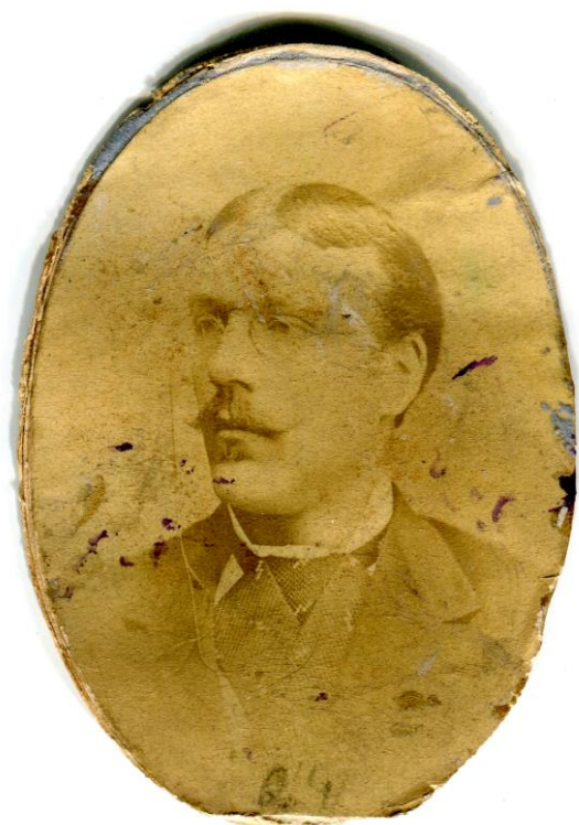
Рис. 3. Кароль Гадачек Fig. 3. Karol Hadaczek

музею предмети і все це принести в дар своєму народу», – зауважував автор одного з них [Посмертне wspomnienie, 1913, с. 201].