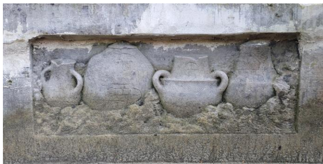
Рис. 5. Могила Кароля Гадачека на Личаківському кладовищі.