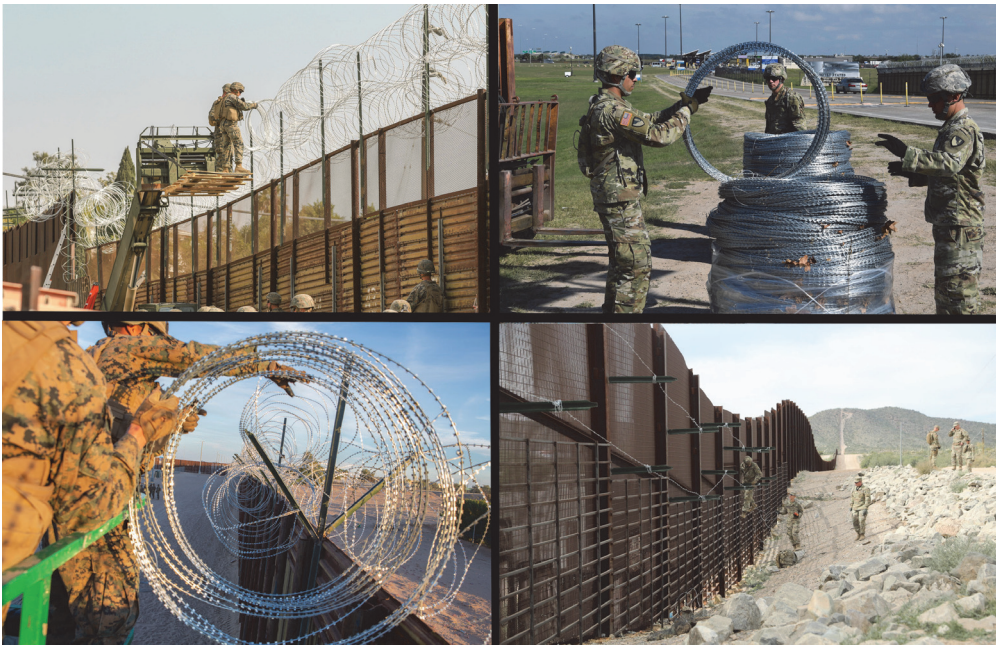
Фото 1. Типові фотографії структур зі зв'язків із громадськістю МО США демонструють військовослужбовців у засобах індивідуального захисту, без зброї, які виконують завдання із фортифікації кордону в листопаді 2018 р.

проте потрапив до журналістів газети «Newsweek». Відповідно до нього, нові правила дозволяли демонстрацію або застосування сили (зокрема летальної, за необхідності), контроль натовпу, тимчасове затримання і проведення поверхових обшуків. Це автоматично спричиняло юридичні дискусії щодо правомірності застосування ЗС і лімітів їхніх повноважень відповідно до Закону про Posse Comitatus (LaPorta, 2018). Міністр оборони США Дж. Меттіс, коментуючи документ, зазначив, що застосування ЗС не порушує дозволених законом межі, підрозділи не здійснюватимуть арешти і виконують інженерні роботи без штатної зброї. Він зазначав, що якщо війська використовуватимуть як додаткову захисну силу, то це будуть представники військової поліції, «озброєні щитами та кийками, без вогнепальної зброї», і вони зможуть тимчасово затримувати мігрантів для подальшої передачі правоохоронним органам лише за прямого нападу на прикордонників (Morgan, 2018).