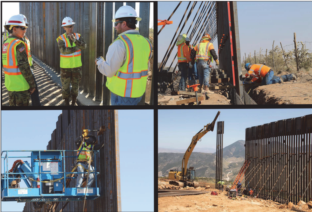
Фото 2. Типові фотографії структур із зв'язків із громадськістю МО США, сфокусовані на опосередкованій участі військовослужбовців у здійсненні прикордонних будівельних проєктів

З 2018 р. по 2020 р. Корпус інженерів армії США уклав контракти на суму понад 10 млрд дол. на будівництво південної прикордонної стіни. Більша частина цих грошей надійшла від МО. Відповідно до законів США, ці кошти повинні мали бути використані протягом фінансового року. Цей дедлайн змусив корпус швидко домовлятися з підрядниками, зокрема було укладено неконкурентних контрактів на суму 4,3 млрд дол. Окрім того, корпус дозволив кільком фірмам розпочати роботи зі зведення стіни, коли умови контракту ще обговорювали. Це не призводило до максимальної економії коштів, однак пришвидшувало терміни будівництва (Dickstein, 2018). На час закінчення терміну надзвичайного стану і зупинки робіт у січні 2021 р. корпус уклав контракти на будівництво понад 450 миль прикордонної стіни й інших бар'єрних загороджень. Рисунок 2 демонструє ділянки робіт, на зведення яких Корпус інженерів армії США уклав контракти протягом 2018–2020 ф. р. (DiNapoli, 2021).