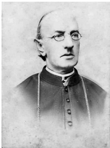
Сильвестр Сембратович (1836–1898) – митрополит Галицький, архієпископ Львівський, єпископ Кам'янець Подільського, кардинал (1885–1898)*

настановами щодо просвітницької роботи в громадах 9 . Також єпископат ставав ініціатором та підтримкою заходів для покращення доступу українцям до здобуття освіти загалом і виховання національної свідомості в освітніх закладах зокрема. Поза тим варто зазначити, що в опції ієрархів кінця XIX ст. проблема суспільного служіння ще не набула потуги й цілісного концептуального виразу.