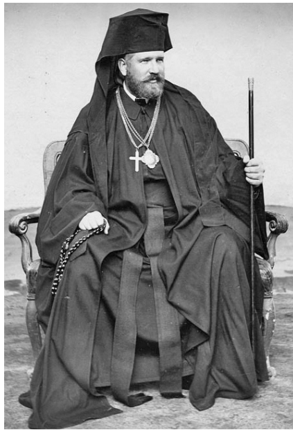
Андрей Олександр граф Шептицький (1865–1944) – Чин святого Василія Великого, єпископ Станіславівський (1899–1900), митрополит Галицький, архієпископ Львівський, єпископ Кам'янець-Подільського (1900–1944)

Активну політичну позицію займав також і греко-католицький єпископат. Показово, що 21 січня 1906 р. владики (митрополит Галицький Андрей Шептицький, єпископ Перемишльський Костянтин Чехович і єпископ Станіславівський Григорій Хомишин) очолили українську депутацію до цісаря з нагоди проведення виборчої реформи, щоб добиватися для українців рівних з іншими народами імперії виборчих прав. Протидіючи поширюваній поляками візії українців як небезпечного радикально налаштованого народу з непевними симпатіями і настроями, єпископи на аудієнції з цісарем донесли йому національні прагнення народу