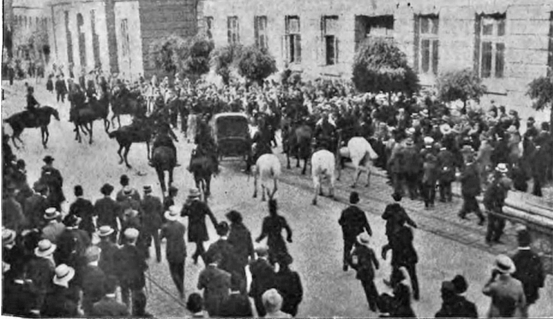
Перевезення арештованих українських студентів до будівлі карного суду у Львові по вул. С. Баторія (тепер – вул. Князя Романа) 9 липня 1910 р. фотограф М. Мюнци*

пинити навчання та зачинити університет 201 . 22 березня було вирішено й долю заарештованих українських студентів. Керівництво навчального закладу відрахувало 11 учасників заворушень 23 січня, щодо решти тривало дисциплінарне слідство 202 .