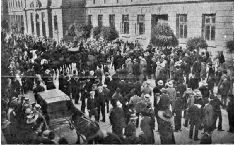
Демонстрація проти арешту українських студентів перед будівлею карного суду у Львові. 9 липня 1910 р.

ської молоді. Під час організації різних акцій студентські товариства почали кооперуватися з політичними партіями, також вони поставили за мету залучити до боротьби якомога більше українського населення. Тому вони перенесли акцент своєї діяльності зі столиці краю у провінцію, популяризуючи питання заснування українського університету серед селян і міщан.