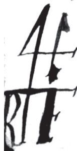
Рис. 4. Торговий знак Роберта Форбса із символом «4» та його ініціалами. Варіант 2