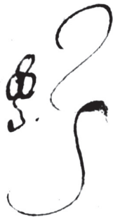
Рис. 8. Торговий знак, складений за допомогою трьох кругів і хвилястої ніжки-основи, його власник невідомий. Варіант 1