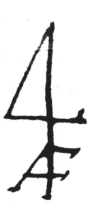
Рис. 2. Торговий знак Артура Форбса із символом «4» та його ініціалами