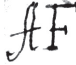
Рис. 5. Торговий знак-аббревіатура Артура Форбса