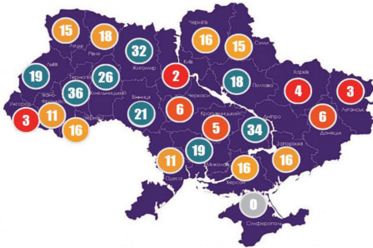
Рис. Об'єднанні територіальні громади України (на 01.01.2017 р.) 21

2017 р. – 01.01, 19.03, 16.04; двічі у 2018 р. – 01.01, 05.05, раз у 2019 р. (на 01.05) – 01.01(рис.) 20 .